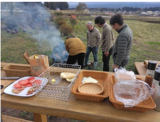
「ホットサンドウィッチ」づくり…

You Tube 📺 https://www.youtube.com/watch?v=i8_5WzZ4ucs