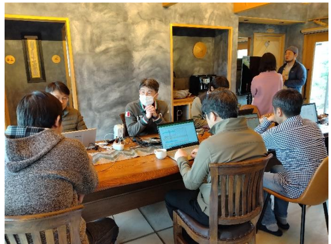
15時から「ディスカッション」開始