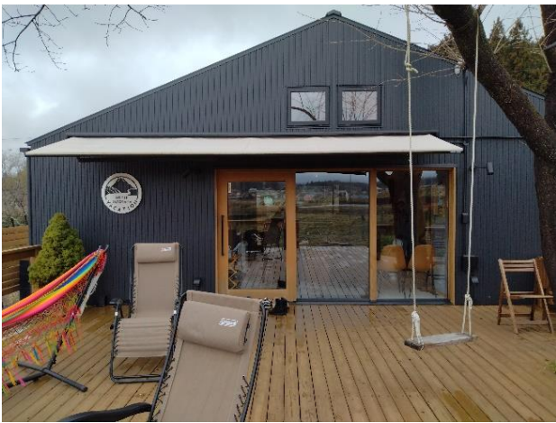
真正面に富士山を望むウッドデッキ

You Tube https://www.youtube.com/watch?v=2Wvg33UsLUo