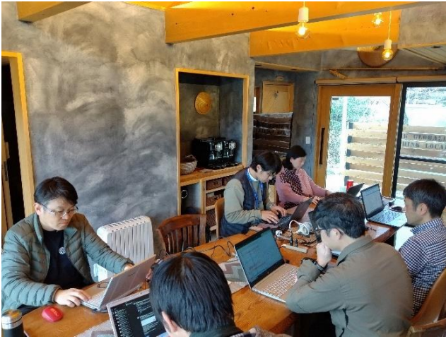
初日の午後 先ずは各自の「ワーク」から