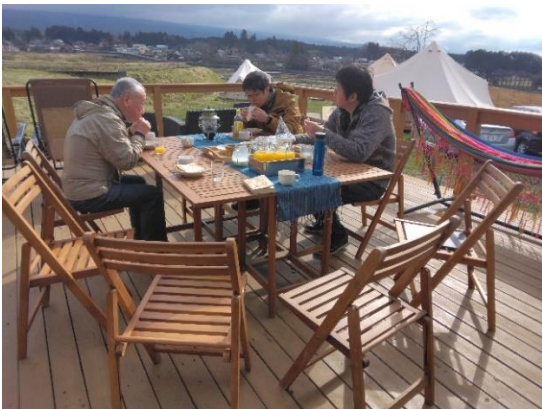
ウッドデッキで朝食(残念ながら富士山は見えない)