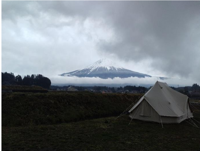
オープニングの富士山

You Tube https://www.youtube.com/watch?v=2Wvg33UsLUo