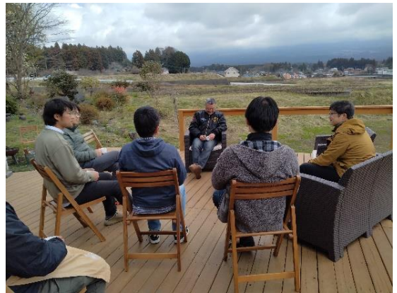
雲の向こうで隠れて富士山も参加？